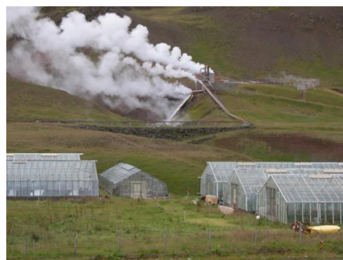
Рис. 4. Тепличное хозяйство в Исландии

Туризм. В транспорте особо значима роль тех видов, которые позволяют