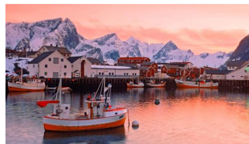
Рис. 2. Рыбацкий поселок

населения концентрируется на юге, вдоль побережий Балтийского и Северного морей. Внутренние горные районы и заполярные территории – наименее заселенные в Европе. Для стран Северной Европы характерен высокий уровень урбанизации. В городах проживает 94 % населения Исландии, 84 % – Швеции, 74 % – Норвегии и 65 % – Финляндии. Преобладают небольшие города с