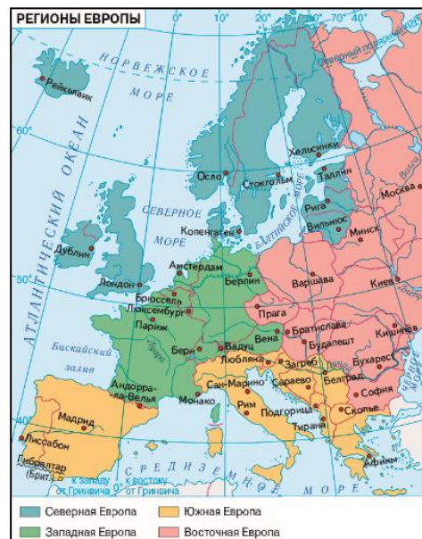
Рис.1. Регионы Европы

29.1. Социально-экономические регионы Европы. В соответствии с классификацией ООН в Европе выделяются 4 региона: Южная Европа, Западная Европа, Восточная Европа и Северная Европа (рис. 1). В основу выделения регионов положен географический принцип. Учитывается также культурная близость стран, общность их исторического развития. В Южную Европу входят в основном полуостровные средиземноморские государства. Ключевую роль среди них играют Италия, Испания и Греция. Западная Европа включает наиболее развитые и мощные в