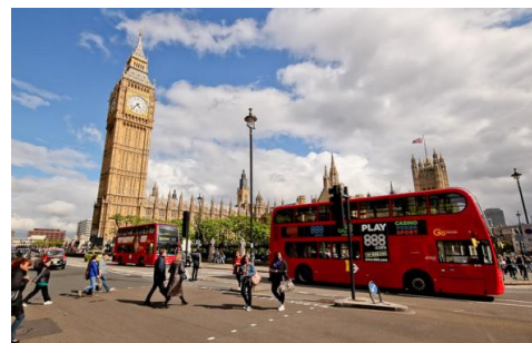
Рис. 1. На улицах Лондона

Умеренный морской климат с большим количеством осадков благоприятно сказывается на хозяйственной деятельности людей. Страна богата внутренними водами. Одна из крупнейших рек Великобритании – Темза. В ее бассейне проживает около 20 % населения страны и расположена столица государства – г. Лондон (рис. 1).