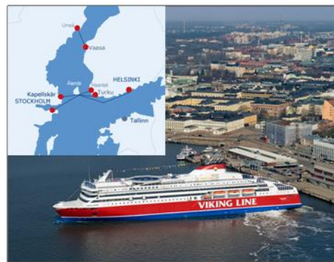
Рис. 5. Паромная переправа между портами региона