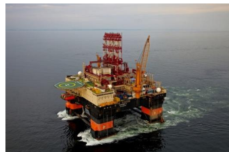
Рис. 3. Добыча нефти в шельфе Северного моря

По объемам их добычи Норвегия лидирует в Европе и является крупным экспортером. Богатые гидроэнергетические ресурсы региона способствуют развитию гидроэнергетики. В Норвегии на ГЭС вырабатывается более 90 % потребляемой электроэнергии. В Швеции, богатой урановыми рудами, около 50 % электроэнергии производится на АЭС. Во всех странах Северной Европы большое внимание уделяется развитию альтернативной энергетики, основанной на использовании возобновляемых источников энергии.