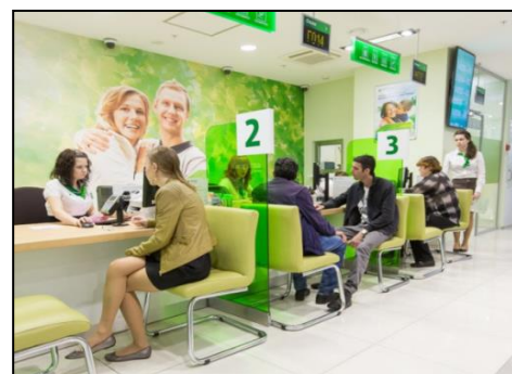
Рис. 3. В операционном зале банка

С учетом перечисленных особенностей происходит размещение предприятий сферы услуг. Если предприятия материального производства могут размещаться в одном месте, а их продукция потом поставляется во все страны мира, то