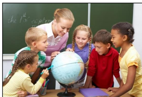
Рис. 4. В учреждении образования